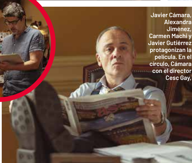
Javier Cámara, Alexandra Jiménez, Carmen Machi y Javier Gutiérrez protagonizan la película. En el círculo, Cámara con el director Cesc Gay,