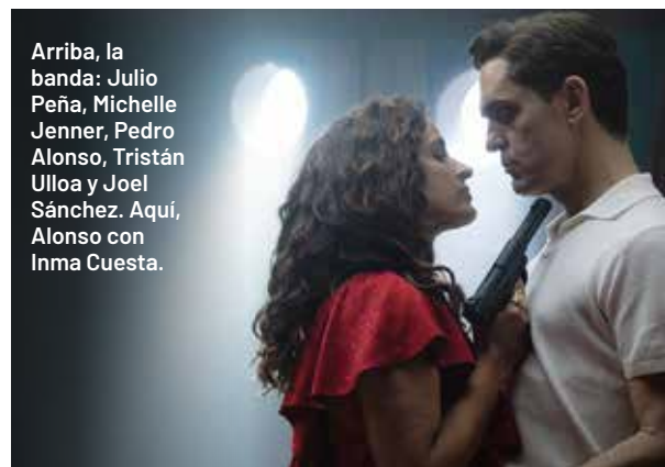
Arriba, la banda: Julio Peña, Michelle Jenner, Pedro Alonso, Tristán Ulloa y Joel Sánchez. Aquí, Alonso con Inma Cuesta.

tienes tu versión, tu perspectiva de la vida y lo has enfocado así.